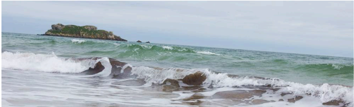
Marcel Dinahet, Houat (détail), mars 2013 © Marcel Dinahet

A l'occasion des 30 ans des Frac, célébrés tout au long de l'année 2013 dans l'ensemble des régions, le Fonds régional d'art contemporain Bretagne organise une série d'expositions dans le sillage d'Ulysse.