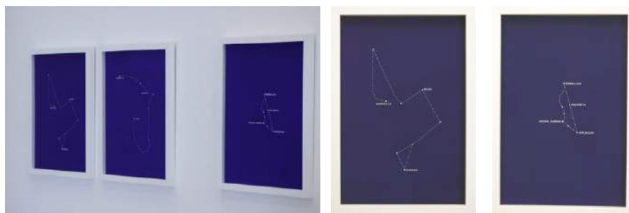
Bouchra Khalili The Constellations , 20112 8 Sérigraphies sur papier BFK Rives 60X40 cm © Bouchra Khalili – Galerie Polaris