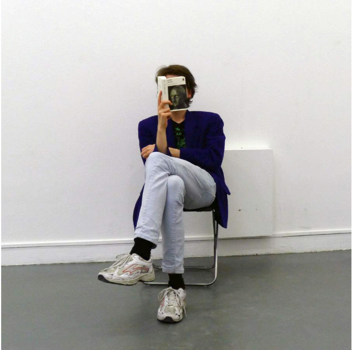
Mark Geffriaud, vue de l'exposition "The Police Return to the Magic Shop", Jeu de Paume, Paris, 2011