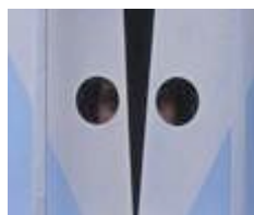
Time Laughs Back at You Like a Sunken Ship , 2012 Film Super 8 transféré sur vidéo HD, couleur, son

A travers Time Laughs Back at You Like a Sunken Ship , film Super8 transféré en vidéo HD, il capture des images qui parlent de l'histoire, l'oubli et l'(im)permanence du monde physique qui nous entoure. Les scènes incluent une ruine antique romaine d'Alexandrie, un navire flottant sur un horizon indiscernable et un homme portant un étrange et futuriste miroir lorsqu'il déambule dans un jardin majestueux. Décrit par l'artiste comme «un film sur l'attente, le temps, le vieillissement, l'ennui et cette ombre immense appelé néant», ces images apparemment disparates sont réunies par une bande son envoûtante, poétique qui fait allusion à la propension de Magdy pour l'absurde humour et toujours d'une beauté sublime.