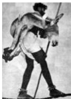
La peur du lieu inconnu, 2001 Sérigraphie 1 couleur (série limitée de 150 exemplaires dont 50 exemplaires numérotés et signés) Imprimé par l'Atelier Leblanc, Paris - Edition cneai =, Chatou) Collection privée

Le travail de cet artiste californien s'inspire de l'histoire et de la culture américaine ainsi que de ses propres mythologies. Observant le tissu social et familial des classes moyennes et pauvres des banlieues américaines, l'artiste se plonge dans l'univers de la jeune génération qui trouve ses repères dans le hard-rock et les combats de catch, et transpose dans son œuvre les codes esthétiques de la culture populaire et underground. La sérigraphie La peur du lieu inconnu (2001), tirée d'une image d'un livre de Philippe Bissières, représente un homme qui porte sur ses épaules, tel un sac de blé, un âne au dessus d'un précipice. Cette image, propice à toutes les interprétations, stimule immédiatement notre imaginaire. D'un potentiel cinématographique indéniable, cette image fait notamment écho au film Un temps pour l'ivresse des chevaux (2000) de Bahman Ghobadi, dans lequel des contrebandiers opérant dans les montagnes entre le Kurdistan iranien et le Kurdistan irakien étaient obligés de saouler leurs chevaux pour qu'ils oublient la peur et la fatigue et osent traverser certains précipices.