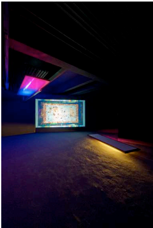
Passerelle Centre d'art contemporain, Brest crédits photographiques : Aurélien Mole, juin 2014