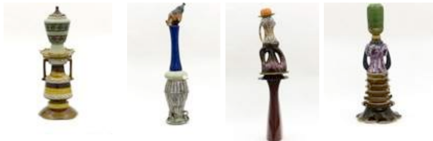
Sans titre , 2011

Dans cette série Sans-titre , il assemble minutieusement ces objets symptomatiques de la culture française d'après-guerre (vases, de pieds de lampe et d'assiettes décoratives), et, en les renversant, fabrique des personnages. Dilettantisme et délire sérieux, déambulation au cœur de l'ordinaire, de ce qui compose le terriblement banal soit parce qu'il est devenu obsolète, soit parce que nous ne le regardons plus, Richard Fauguet combine avec légèreté des objets de décoration, des artefacts vernaculaires, des matériaux domestiques ou de bricolage.