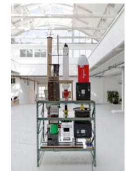
Passerelle Centre d'art contemporain, Brest crédits photographiques : Aurélien Mole, juin 2014