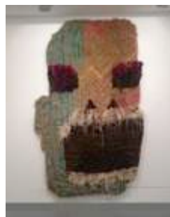
Bfor, 2013 tufté main en laine