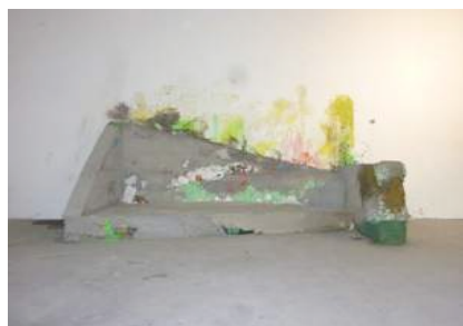
Best R , 2014