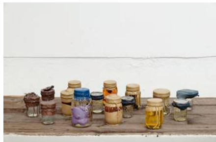
De Stijl Life, 2010 installation Courtesy Galerie GP & N Vallois, Paris