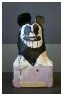
Left Overs , 2008