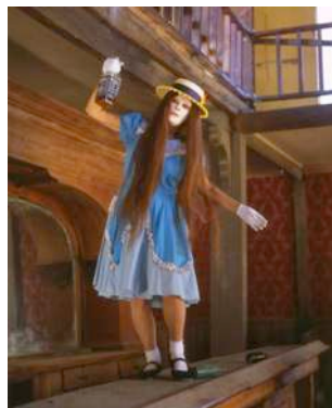
Western Song , 2007 film transféré sur DVD