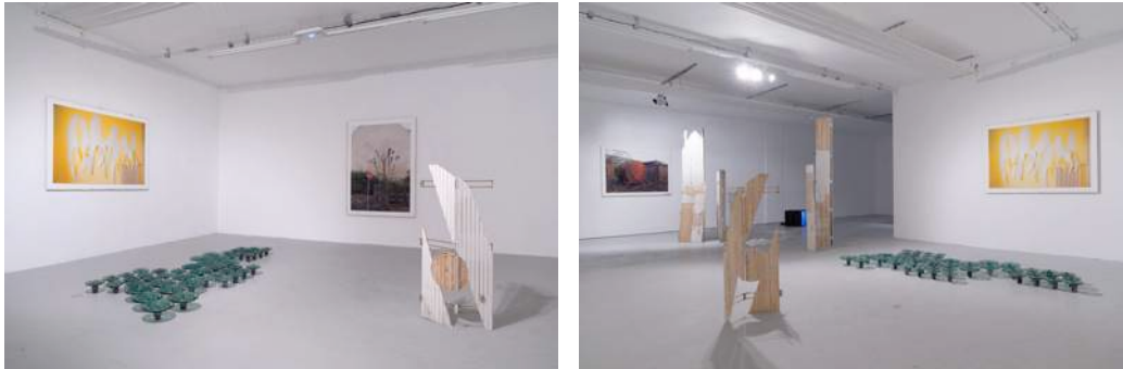
Passerelle Centre d'art contemporain, Brest crédits photographiques : Aurélien Mole, juin 2014