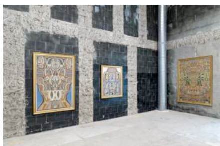
Sans titre , 1939 Sans titre , 1949 Sans titre , 1943 huile sur toile Courtesy Musée d'Ethnologie Régionale de Béthune crédits photographiques : Aurélien Mole, juin 2014.

Mineur de métier, Augustin Lesage élabore une méthode de travail systématique pour construire ses compositions. En 1912, il entend des voix lui disant qu'il serait un peintre. Peu de temps après, Lesage a commencé une immense toile de neuf mètres carrés. Il utilise des gabarits lui permettant de produire un travail régulier et homogène. Les cercles, les angles et les figures minutieuses sont peints à partir de verres, de boutons, de règles, d'équerres, de mètres rubans ou encore de motifs d'ouvrages textiles. Il se passionne pour les dessins égyptiens, beaucoup de ses œuvres sont d'ailleurs riches en symboles religieux de différentes cultures. Les registres en bandes superposées sont issus des premières peintures de Lesage.