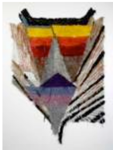
Ray-Inn , 2010 tufté main en laine Collection privée, Paris

Dans ses oeuvres présentées, Ray-Inn et Bfor , Caroline Achaintre utilise la méthode ancestrale du tuffetage, le fait de placer la laine brin par brin sur une base de toile tissée, un procédé qu'elle compare à une peinture de laine. La longueur, la texture et la couleur de chaque fil emprunte aux spécificités de la peinture expressionniste. Travaillant à partir de dessins et d'aquarelles, elle peint littéralement ses masques avec de la laine, reproduisant les couleurs et les couches que l'on retrouve habituellement dans la peinture à l'huile. Caroline Achaintre s'intéresse aux masques parce qu'ils portent un double message: utilisés dans le chamanisme, le théâtre ou le carnaval, les masques suggèrent un état où la réalité et le fantastique existent ensemble.