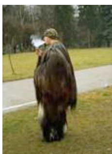
Parking Lot Hydra, 2009 3 tirages argentiques, couleur

Cameron Jamie est né en 1969 et vit et travaille à Los Angeles, Etats-Unis et à Paris, France