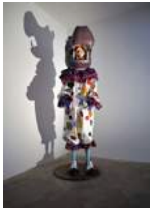
The Hippo Girl , 2008 mousse, résine aqua, voile de surface, tissu, plastique et peinture acrylique sur mannequin en fibre de verre