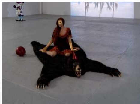
Spirit Girl on A Bearskin Rug (with Baloon), 2009 technique mixte Courtesy Praz-Delavallade, Paris crédits photographiques : Aurélien Mole, juin 2014.

Dans une société fortement patriarcale, ces adolescentes possédaient donc un pouvoir hors du commun. L'artiste mixe ici les croyances chrétiennes à celles, chamaniques, des amérindiens : si les jeunes femmes sont les porte-paroles du monde des morts, les animaux, quant à eux, se voient dotés d'une intériorité toute humaine par le biais d'un anthropomorphisme.