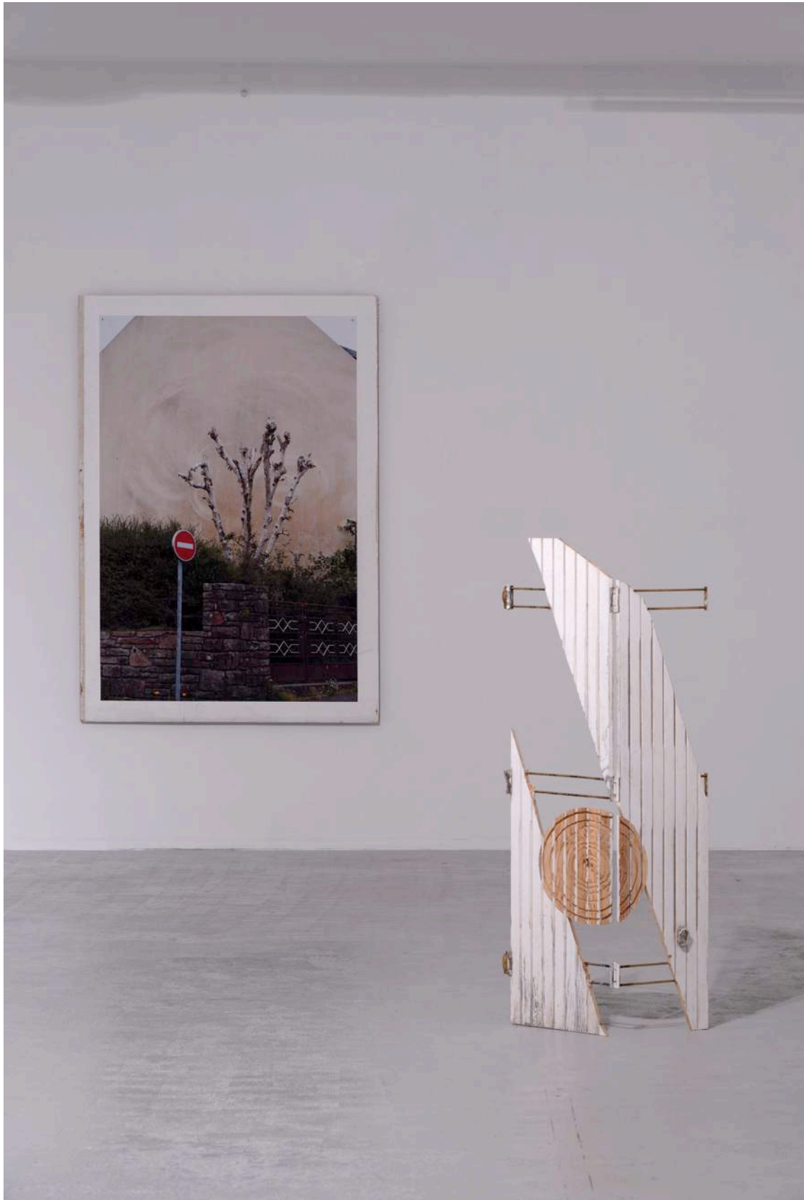
Stéfan Tulépo, Ravalement , 2014

Dans mon Jumpy 1.9TD