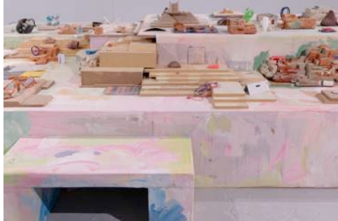
« Ancora tu » (détail), 2014

la fiction : une allégorie où chacun des personnages et des visiteurs semble être à même de définir son propre rôle, selon sa propre liberté d'action. L'artiste conçoit ses sculptures en bois comme les modules d'un espace architectural plus vaste, réalise des objets aux fonctions nouvelles ou inconnues et produit des dessins aux couleurs vives qui mettent en scène des personnages dont les silhouettes seraient humaines et animales, arachnéennes, rampantes ou bondissantes.