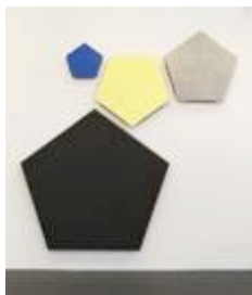
Earth Quartet , 2013 Peinture acrylique, bois, toile, fil, bouchon de bouteille