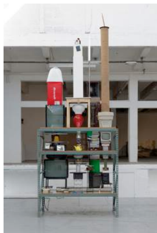
Hommage à Simon Rodia, The Watts Towers (nuestro pueblo), 2009

Dans cette installation intitulée Hommage à Simon Rodia, The Watts Towers (nuestro pueblo) , réalisée en collaboration avec Laëtitia Badaut Haussmann en 2009, Jorge Pedro Nuñez fait référence à cet immigrant napolitain arrivé aux Etats-Unis à la fin du 19ème siècle qui, entre 1921 et 1954, fait édifier dans le quartier de Watts à Los Angeles un ensemble de huit tours composées de câbles d'acier renforcés d'un ciment dans lequel sont incrustés divers objets provenant des décharges publiques (des morceaux de verre et de vaisselle, des coquillages...).