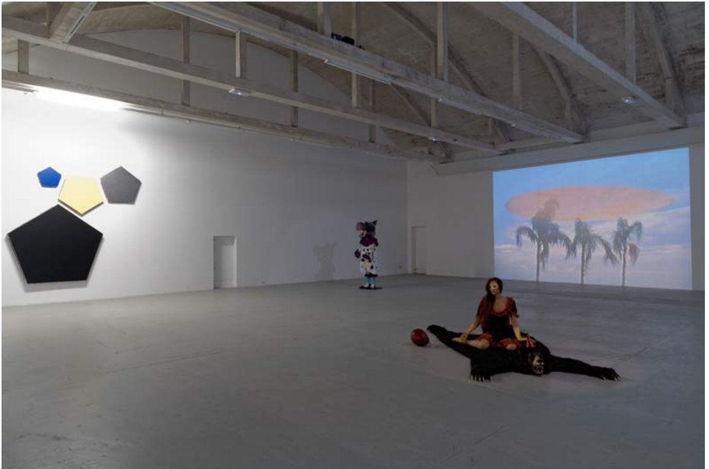
Vernacular Alchemists © Passerelle Centre d'art contemporain, Brest - crédits photographiques : Aurélien Mole, juin 2014