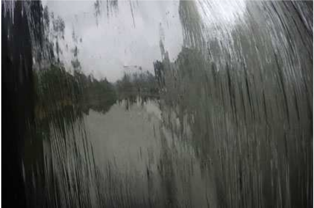
Tania Mouraud, Borderland , 2007, impression jet d'encre sur papier Fine Art